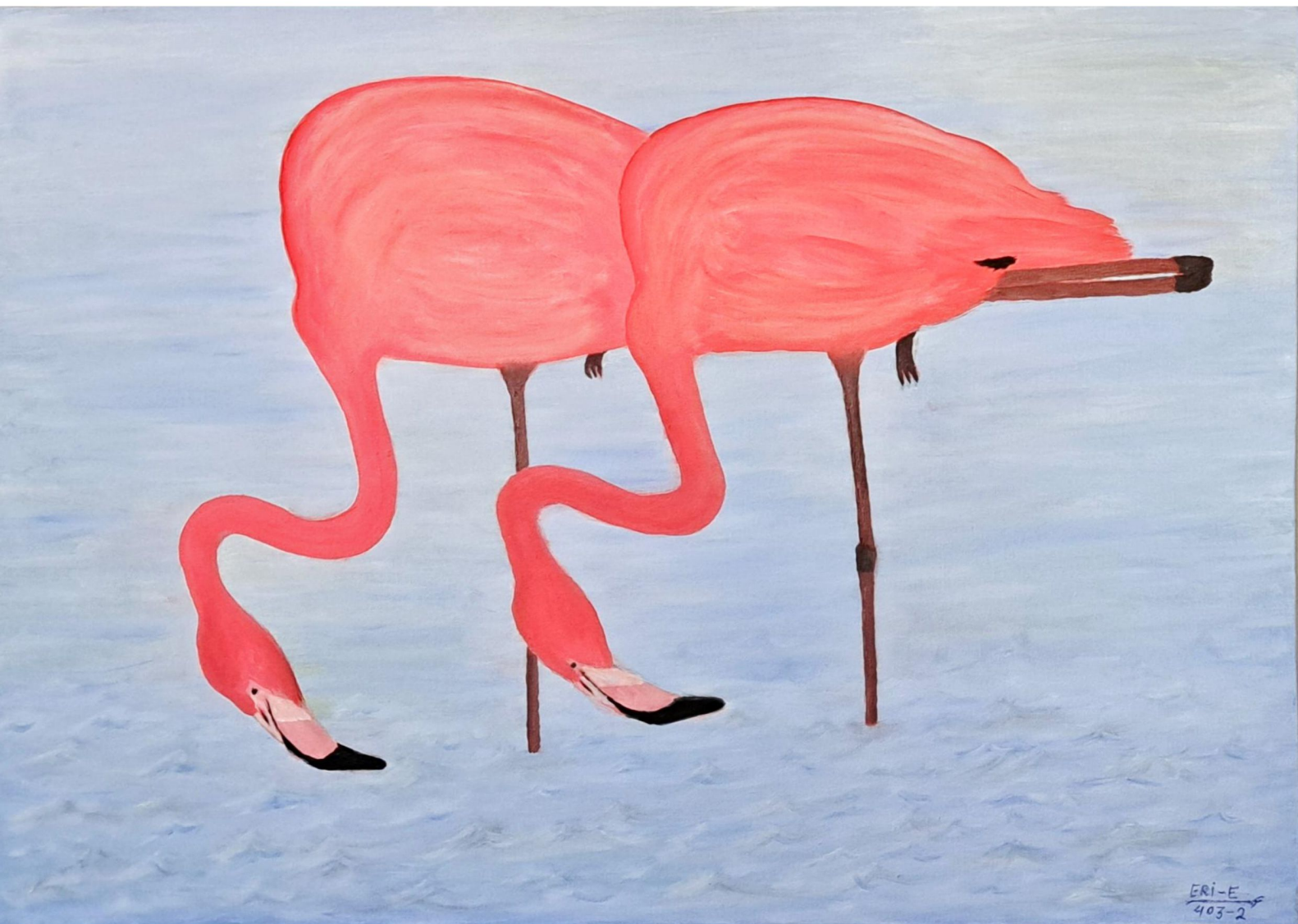
جستجو - 50 x 70 cm - Oil on Canvas - 2024