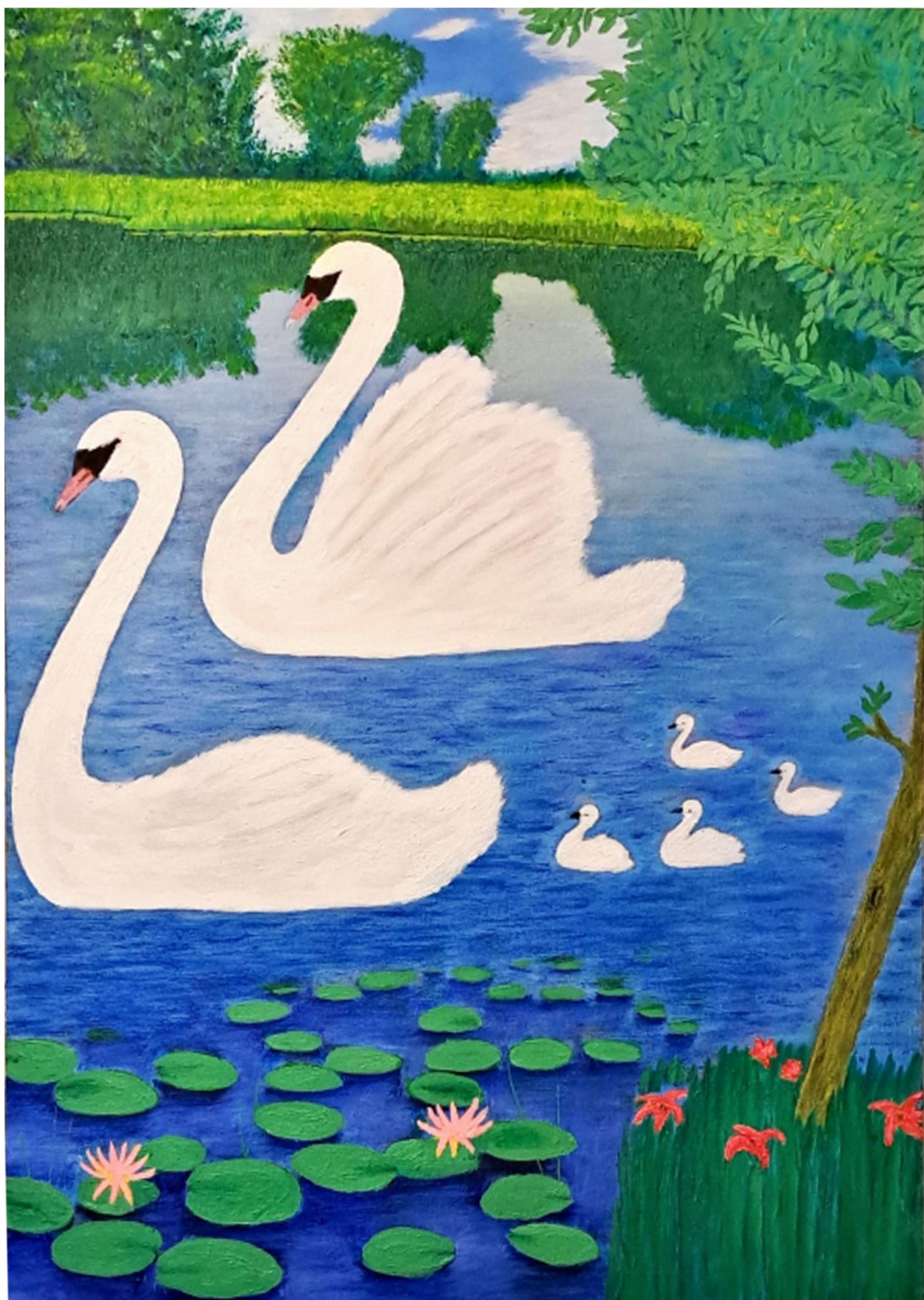
خانواده - 50 x 70 cm - Oil on Canvas - 2024