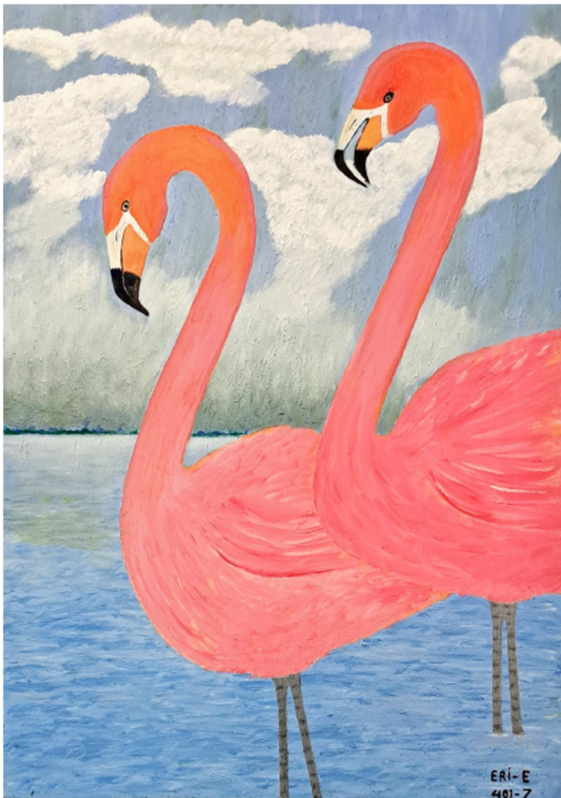
همراه - 50 x 70 cm - Oil on Canvas - 2022