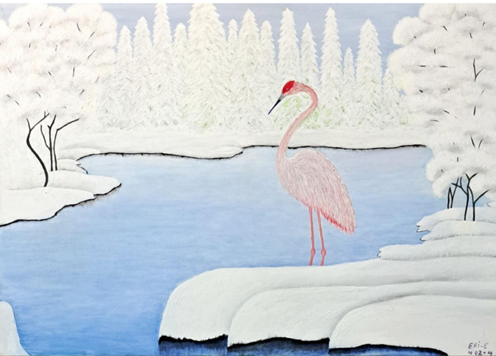
زمستان - 100 x 70 cm - Oil on Canvas - 2023