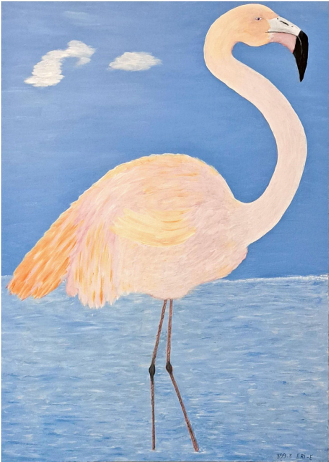
تنها در دریا - 50 x 70 cm - Oil on Canvas - 2020