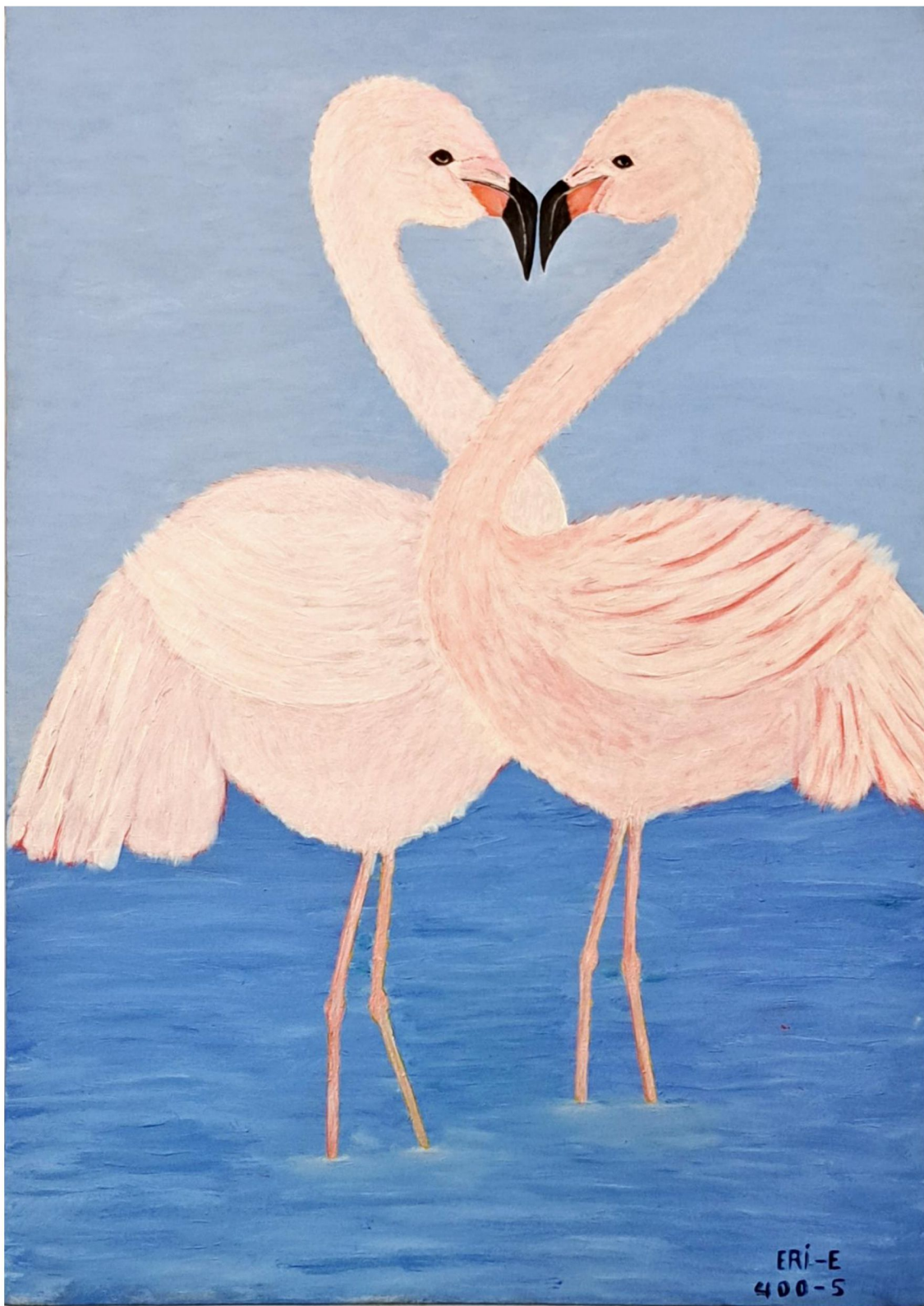
دو دلدادہ - 50 x 70 cm - Oil on Canvas - 2021